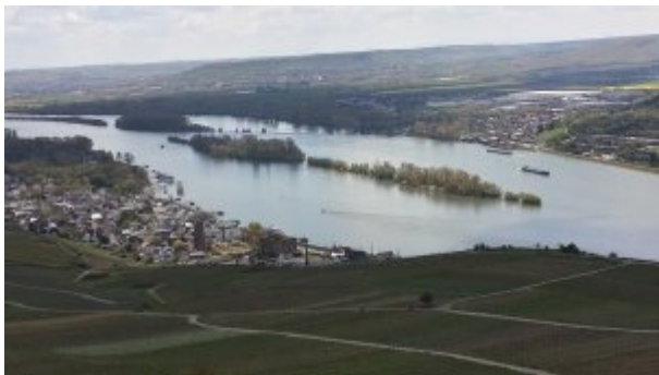
Montée en funiculaire

Aujourd'hui nous avons fait le circuit du « Rhin Romantique » - la découverte de la vallée du Rhin : châteaux, vignobles, et villages du bord du Rhin.