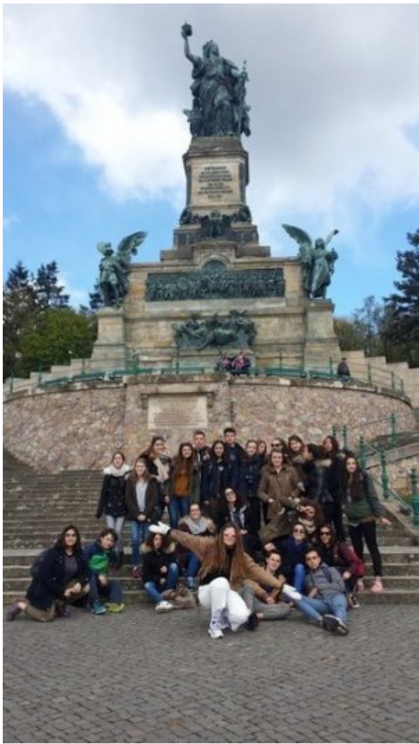
en télé siège.