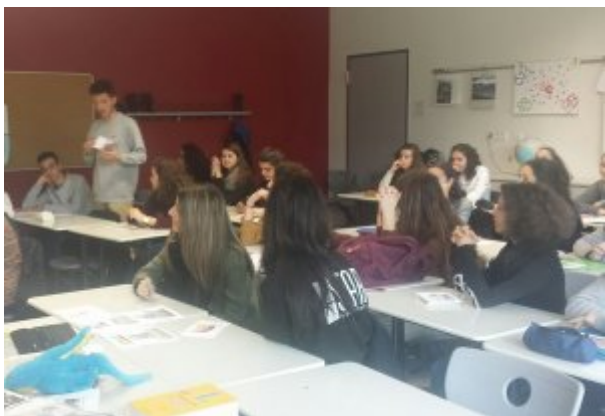
et de français.