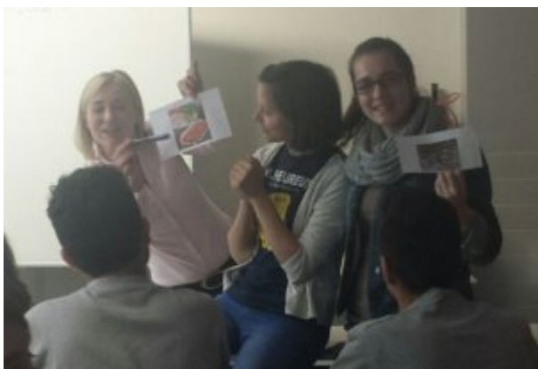
Déjeuner à la cantine