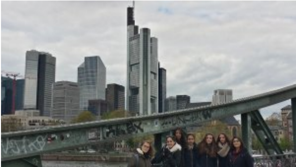
Sur le pont