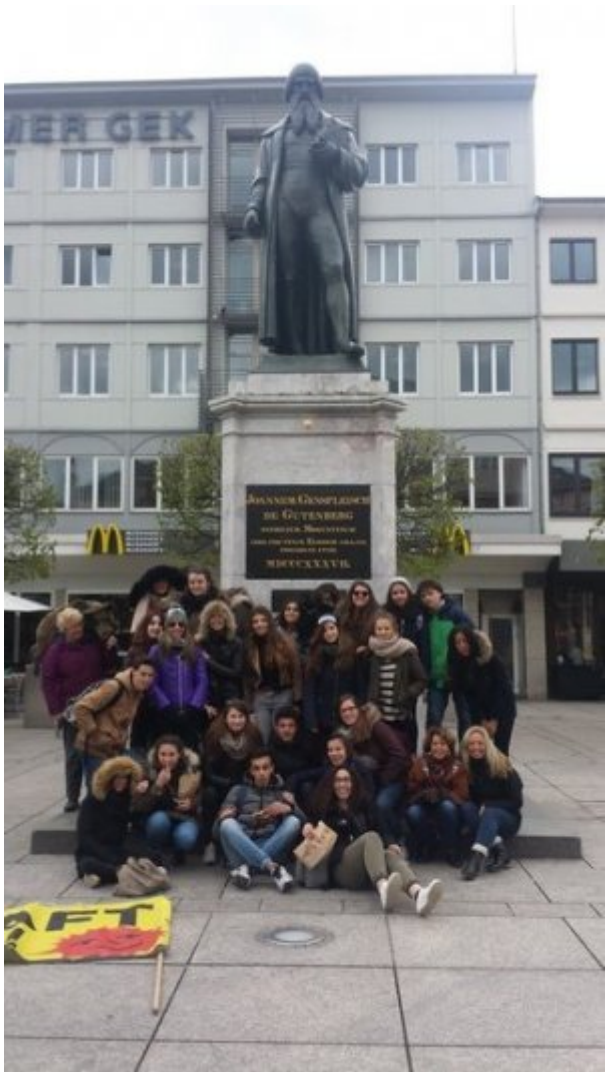
Musée Gutenberg : l'imprimerie