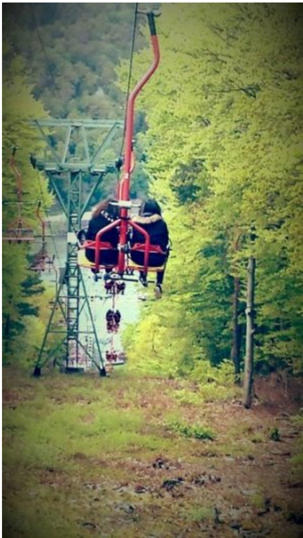
Balade sur le Rhin