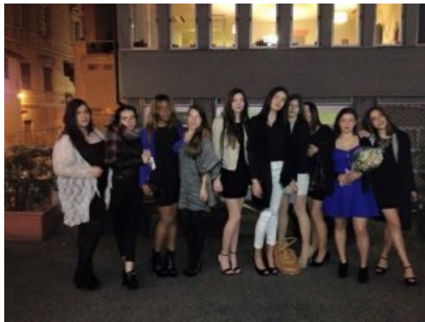
Devant le théâtre