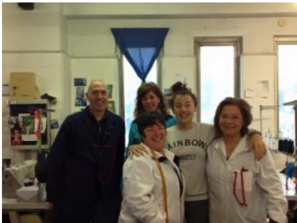
Mardi 29 mars : Des stagiaires avec leurs tutrices.