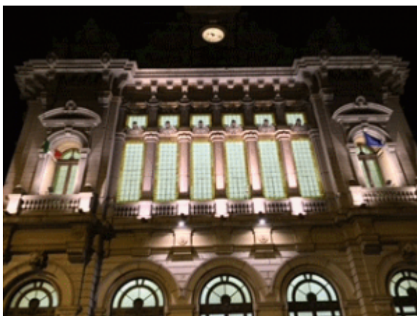
Lundi 14 mars : les photos de Laure Moreno